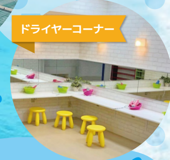
ドライヤーコーナー